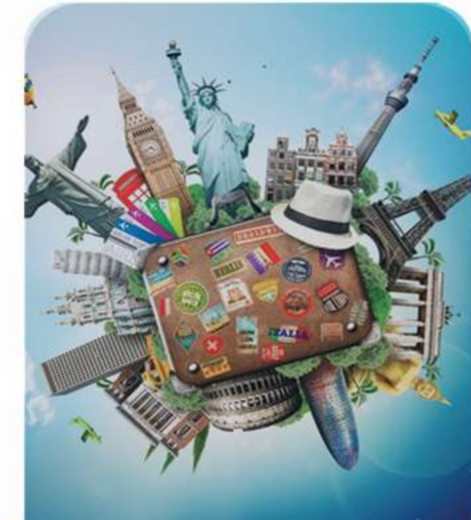
Tourism and Entertainment خدمات السياحة والترفيه