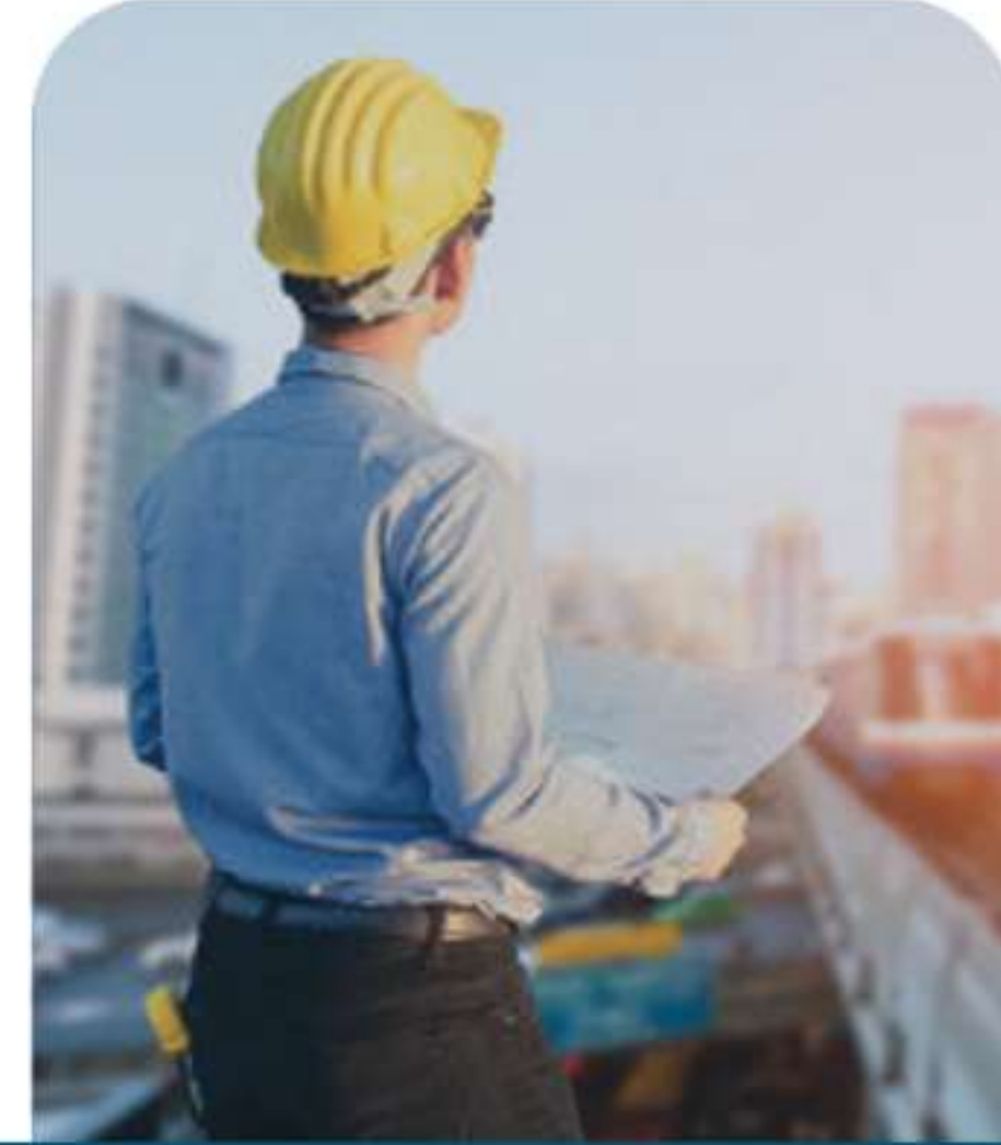
Facility Management خدمات إدارة المرافق