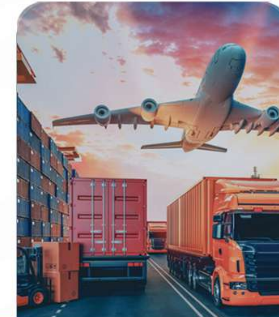
Logistics and Supply Chain الخدمات اللوجستية وسلسلة التوريد