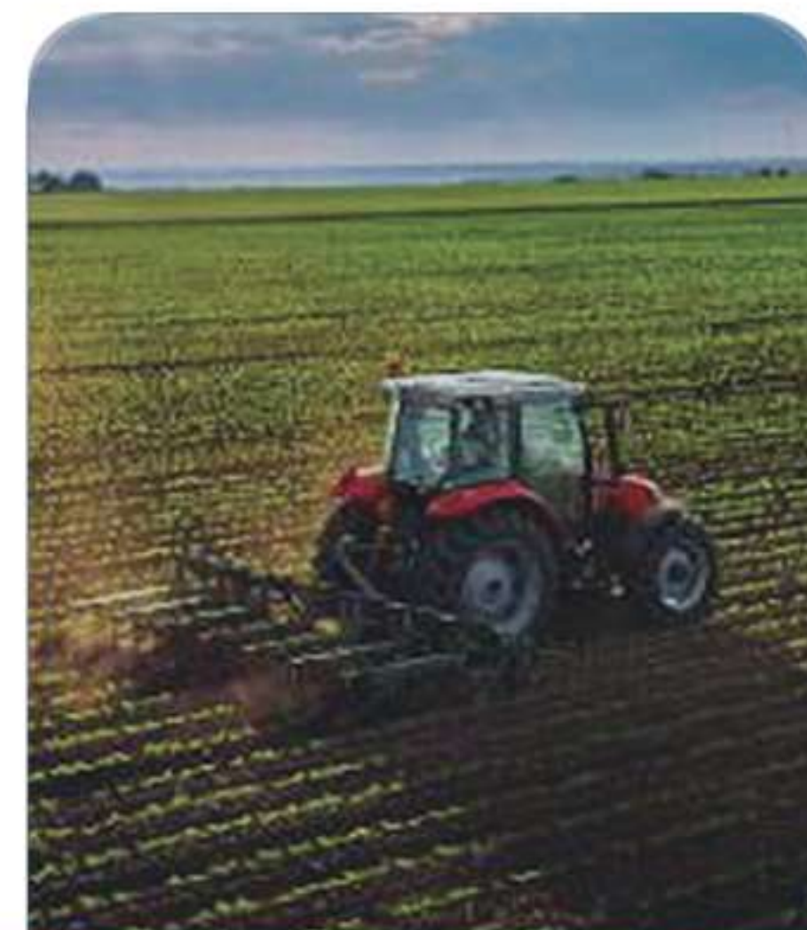
Agriculture and Landscaping خدمات الزراعة والمناظر الطبيعية