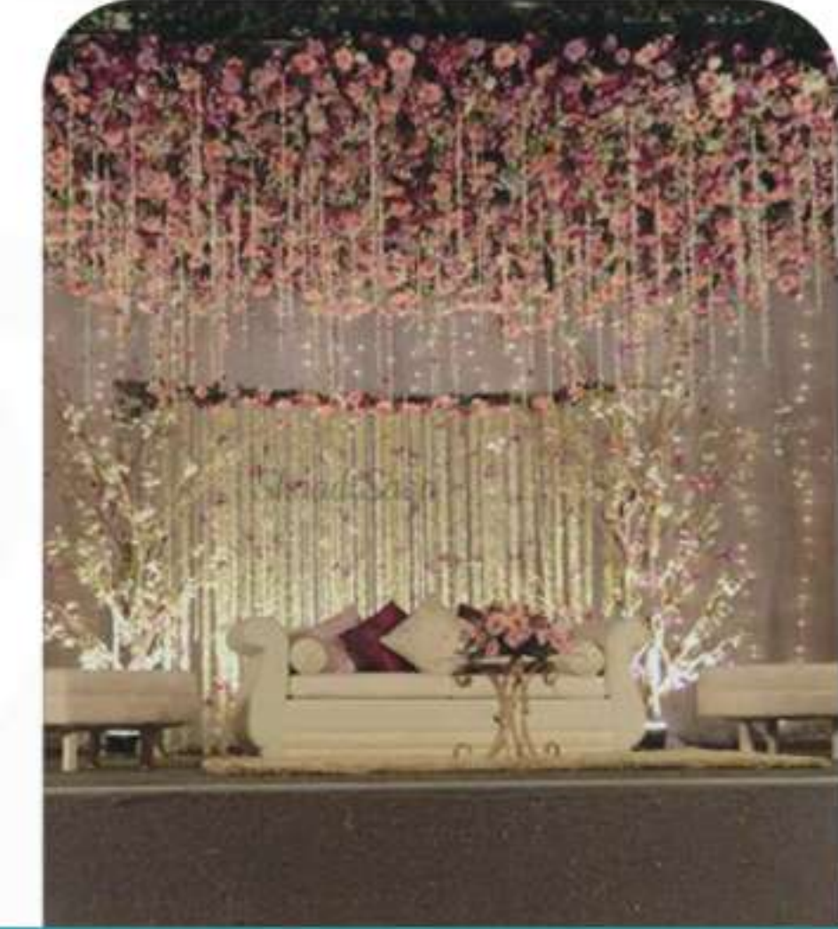
Events Management & Media خدمات إدارة الفعاليات والإعلام