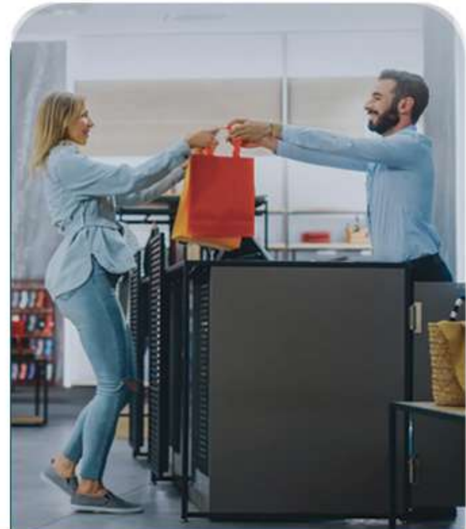
Retail البيع بالتجزئة