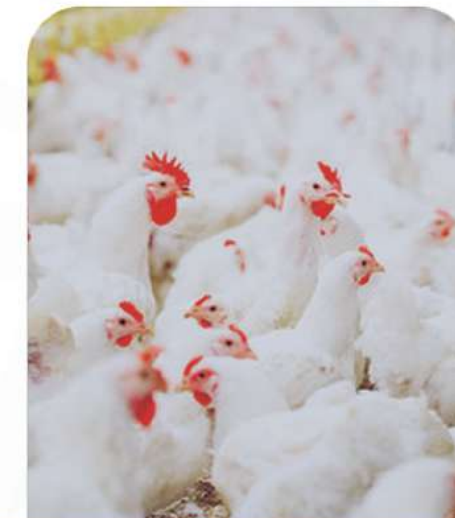
Poultry & Farming خدمات الزراعة وتربية الدواجن