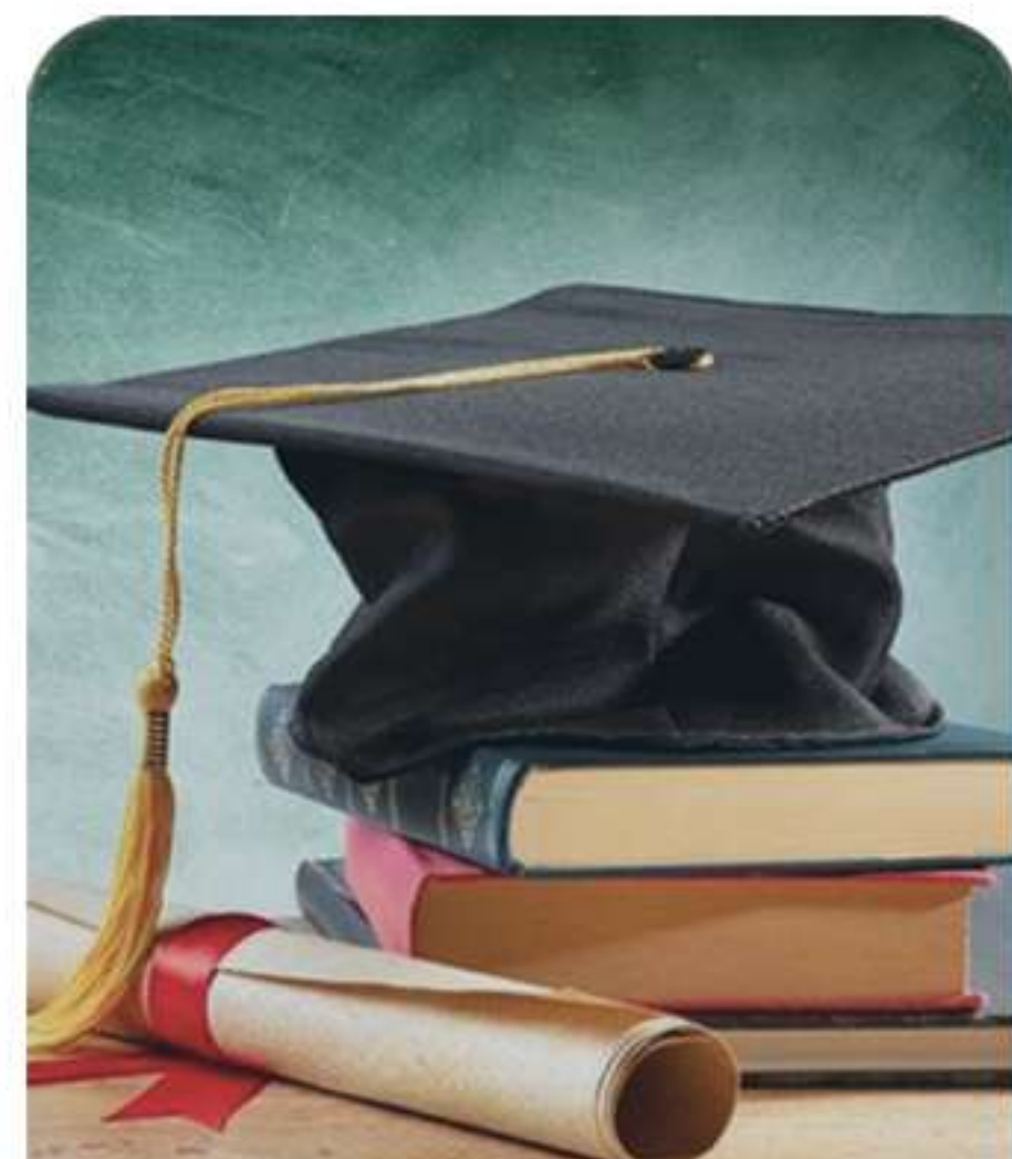
Higher Education Institutions خدمات مؤسسات التعليم العالي