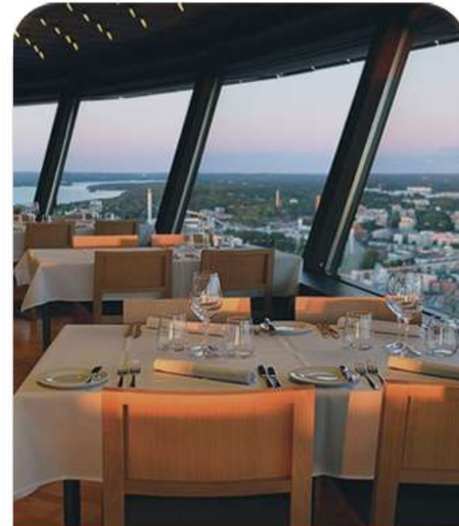
Hospitality, Restaurants, and Cafés خدمات الضيافة والمطاعم والمقاهي