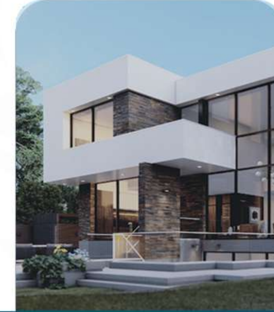
Real Estate خدمات العقار