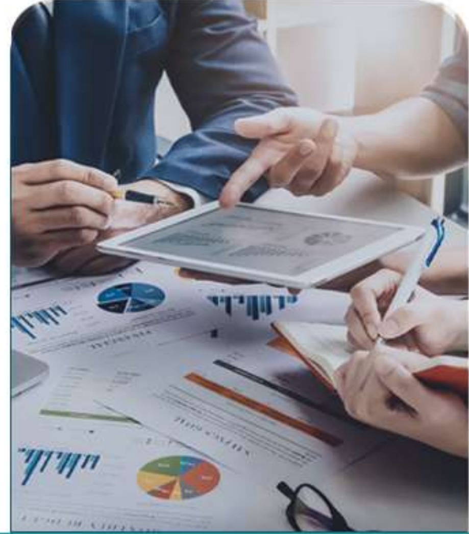
Business Facilities خدمات مرافق الأعمال