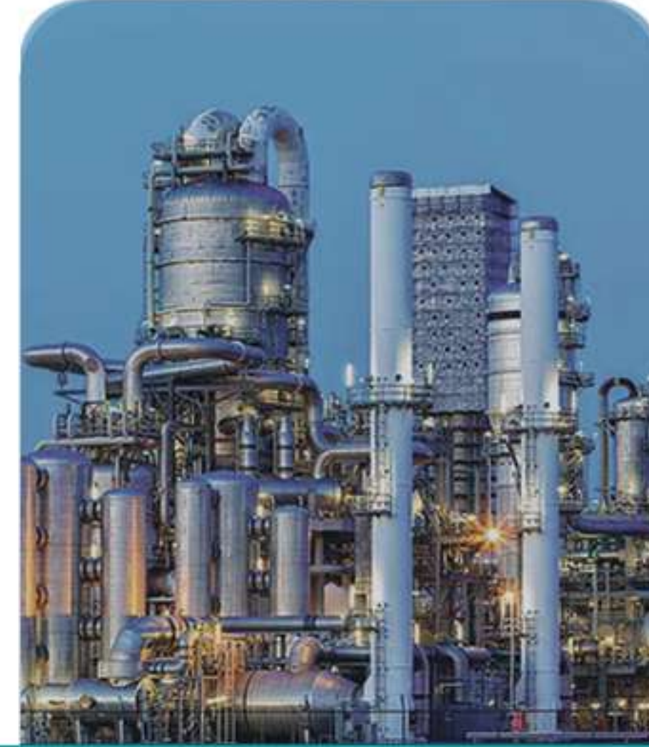
Oil & Gas خدمات النفط والغاز